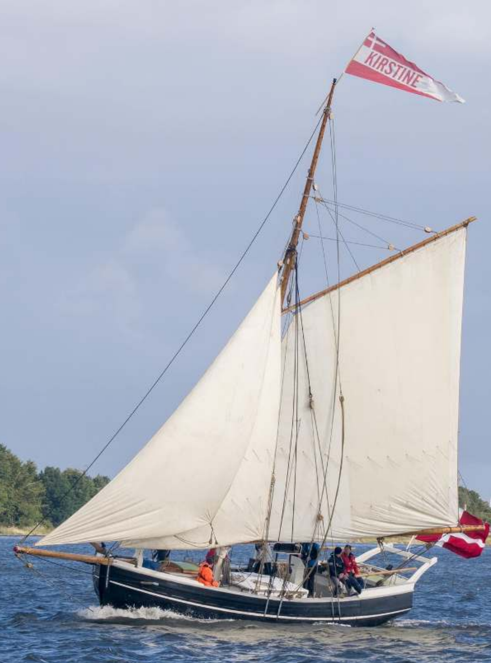
Jagten Kirstine fra 1887 er både i drift og i kyndige hænder på kompetente medarbejdere og dedikerede frivillige.