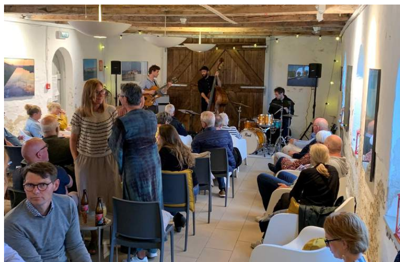
Limfjordsmuseet bruger i stigende grad de fredede bygninger og det fredede fortidsmindet til foredrag, koncerter og gastronomiske oplevelser - ikke mindst i regi af Limfjordsmuseet Snapseri.